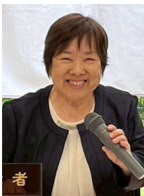
社会福祉法人 桜樹 理事長 児童発達支援センター さくらんぼ園 園長