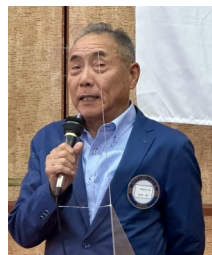
松村ガバナー補佐より2640地区の現状について、お話がありました。