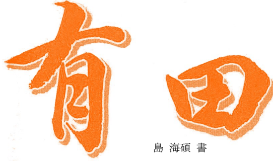
島 海碩 書