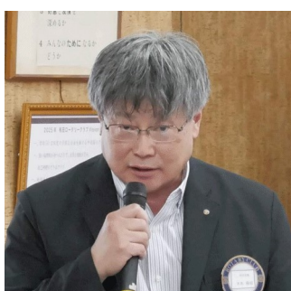
社会奉仕委員会 木本委員長