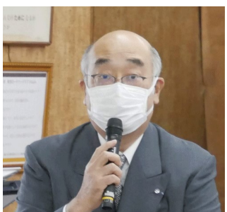
国際奉仕委員会 代理 中元幹事