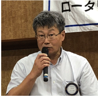
木本社会奉仕委員長