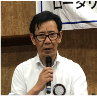
川口職業奉仕委員長