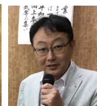
井上社会青少年 奉仕委員長

本日発表しました各委員会の活動報告は後日配布します「クラブ概況」をご覧ください。