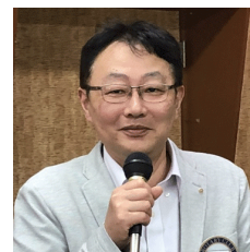
井上会員組織 副委員長