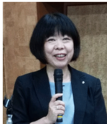
前 ロータリーの友編集長